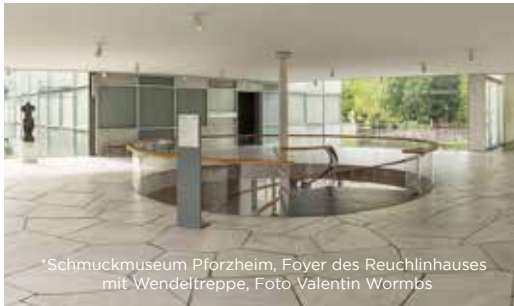
*Schmuckmuseum Pforzheim, Foyer des Reuchlinhauses mit Wendeltreppe