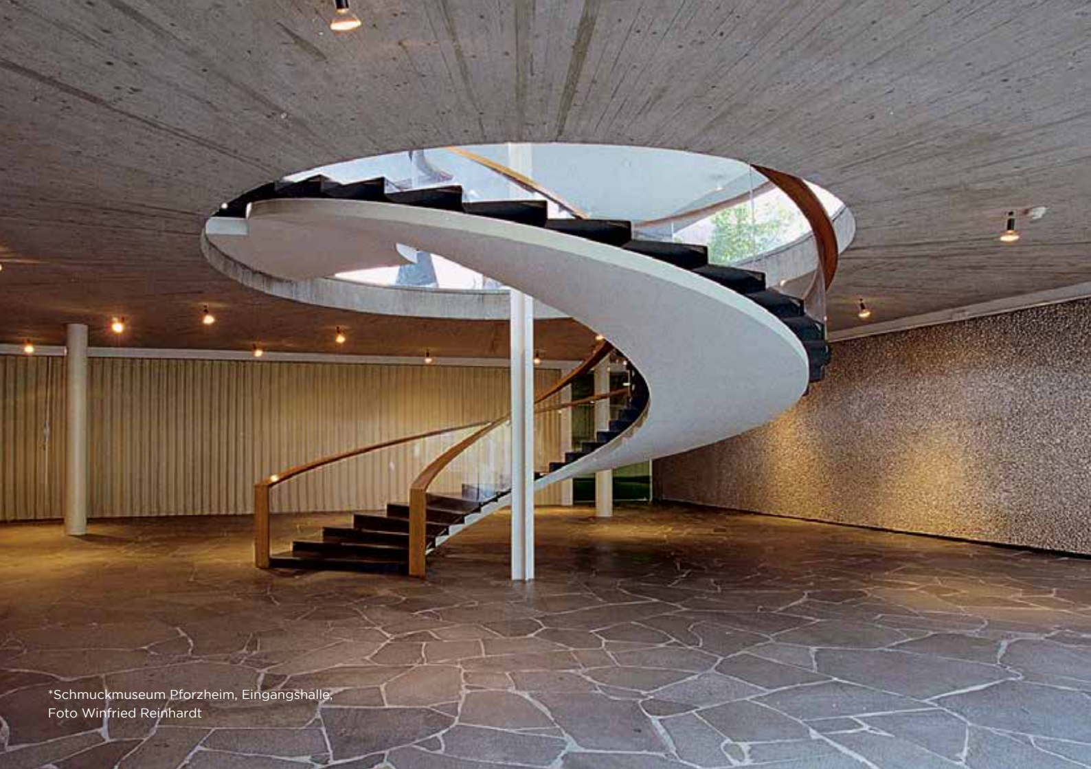
*Schmuckmuseum Pforzheim, Eingangshalle