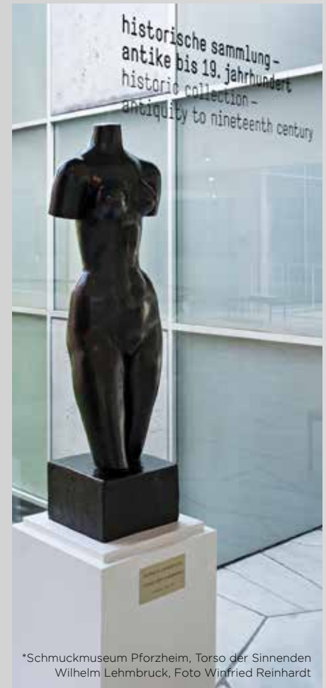
*Schmuckmuseum Pforzheim, Torso der Sinnenden Wilhelm Lehmbruck, Foto Winfried Reinhardt