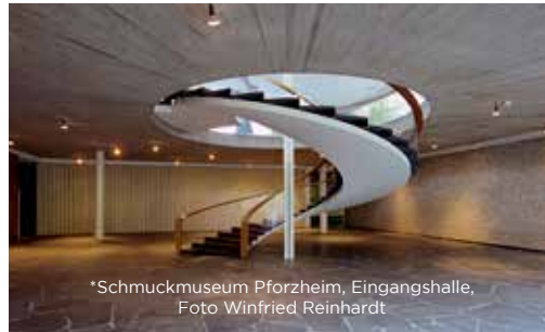
*Schmuckmuseum Pforzheim, Eingangshalle, Foto Winfried Reinhardt