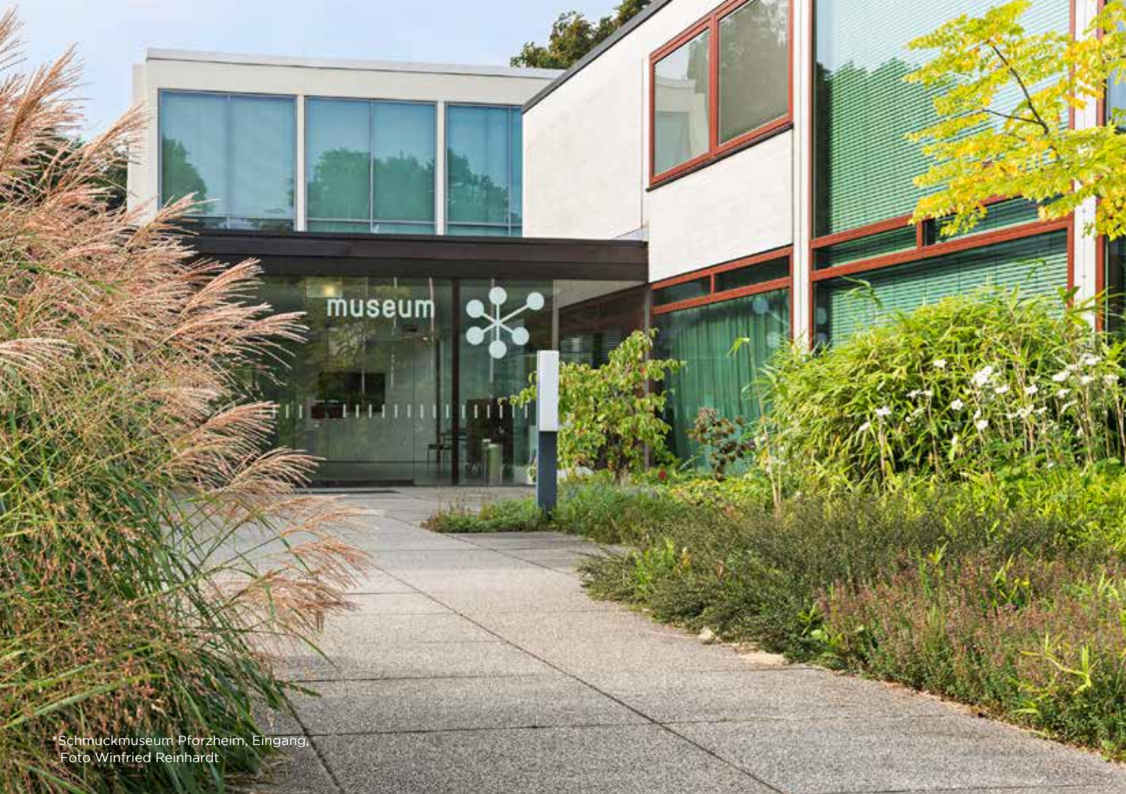
*Schmuckmuseum Pforzheim, Eingang