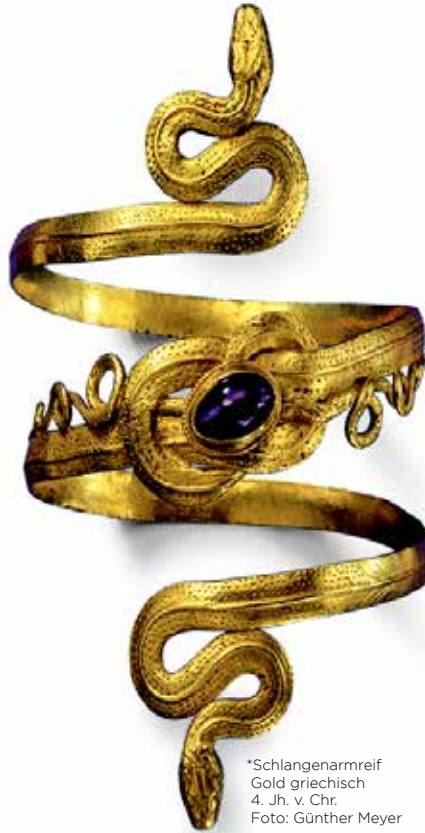
*Schlangenarmreif Gold griechisch 4. Jh. v. Chr.