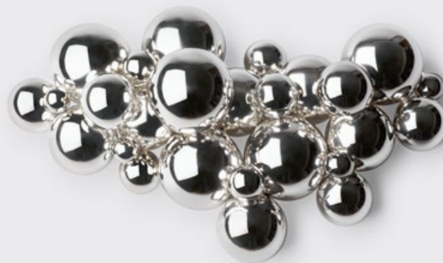
Wandobjekt »Shiny Cloud« David Huycke 2024