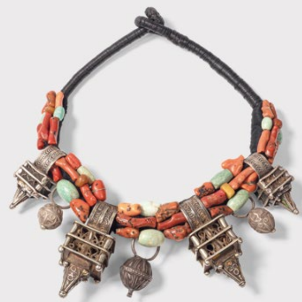
| Afghanistan, Oman oder Schwarzwald?