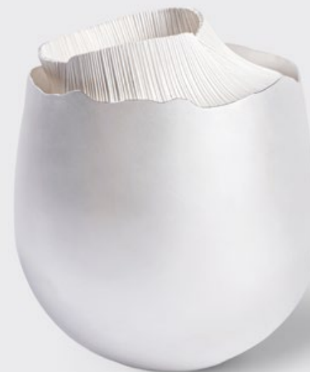
Objekt »Voiceless #1« Zhizhong Li 2024