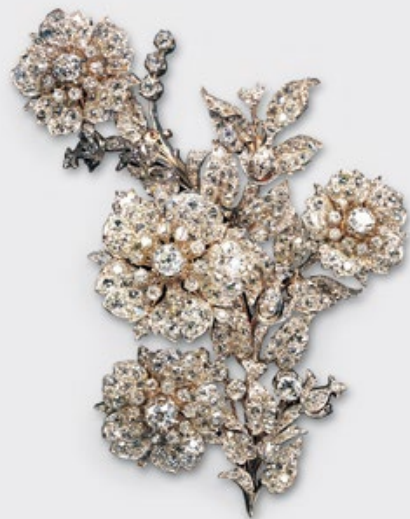
Brosche Englisch oder französisch Um 1860-70

Schmuckmuseum Pforzheim