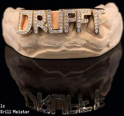
Grillz von Grill Meister