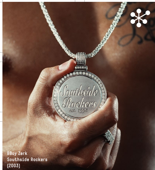
BBoy Zerk Southside Rockers (2003)