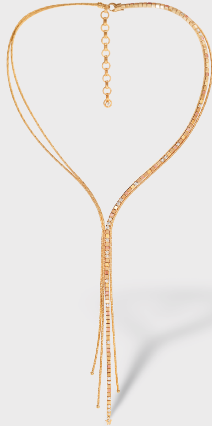
Collier »Glücksverführung« Gold, Brillanten, Wellendorff-Kaltemail