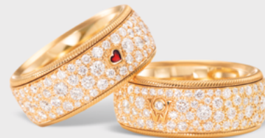
Ring »Wahre Liebe« Gold, Brillanten, Wellendorff-Kaltemail