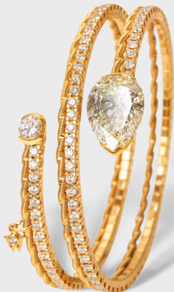
Armband »Umarme mich« federndes Gold, Brillanten

The manufactory's highlights on view invite visitors to get immersed into this fascinating world and to trace the secret of luxury.