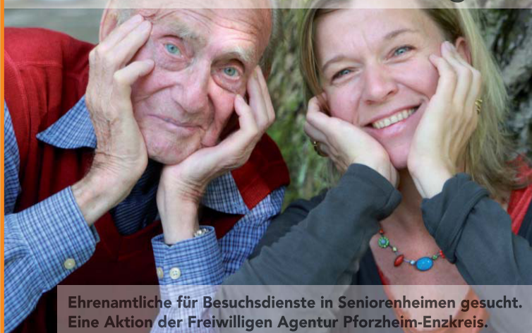
Ehrenamtliche für Besuchsdienste in Seniorenheimen gesucht. Eine Aktion der Freiwilligen Agentur Pforzheim-Enzkreis.