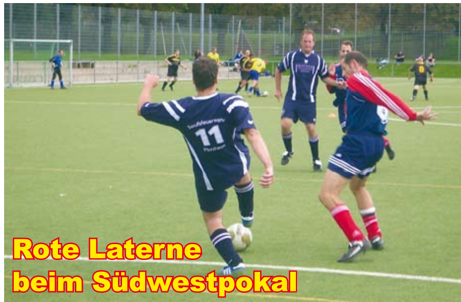
Rote Laterne beim Südwestpokal

Beim 44. Fußball-Südwestpokal der Berufsfeuerwehren in Trier musste sich die Mannschaft aus Pforzheim in diesem Jahr gegen neun weitere Teams aus Baden-Württemberg, Hessen, Rheinland-Pfalz und dem Saarland behaupten.