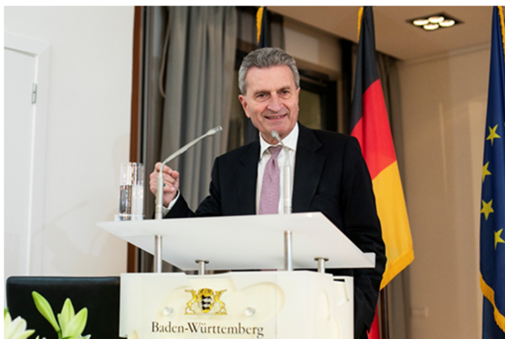
Die Pforzheimer Teilnehmer der Delegation in der Landesvertretung Baden-Württembergs und der deutsche EU-Kommissar Günther Oettinger