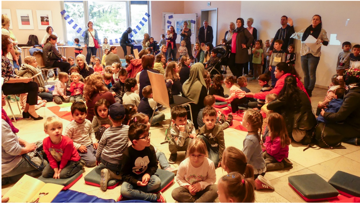
Über 80 Kinder lauschen in der Stadtbibliothek