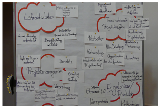
Diskussionen zwischen den Teilnehmern aus unseren Partnerstädten und Pforzheimer Akteuren

Teil des Projekttreffens im Herbst war das Barcamp Europa und Städtepartnerschaften , gefördert durch das Ministerium der Justiz und für Europa: