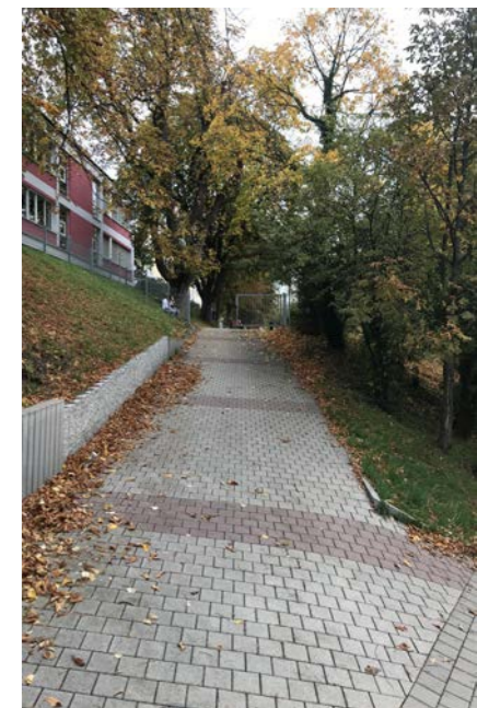
Zugang Schanzschule von der Bayernstraße