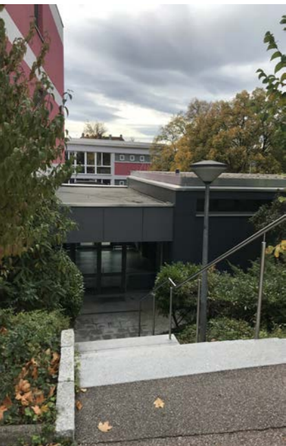
Haupteingang Schanzschule, Habsburgerstraße