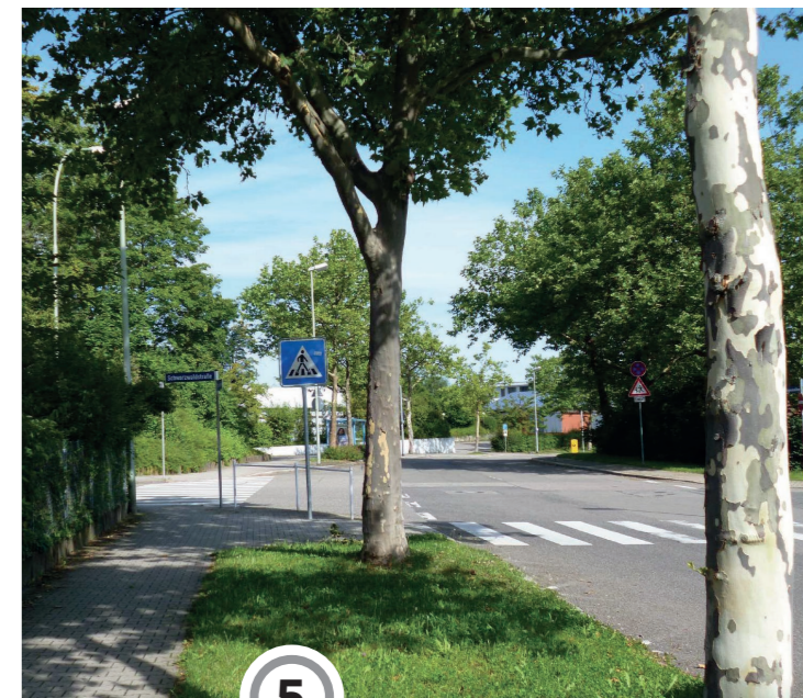
Fußgängerüberweg Vogesenallee, Höhe Schwarzwaldstraße