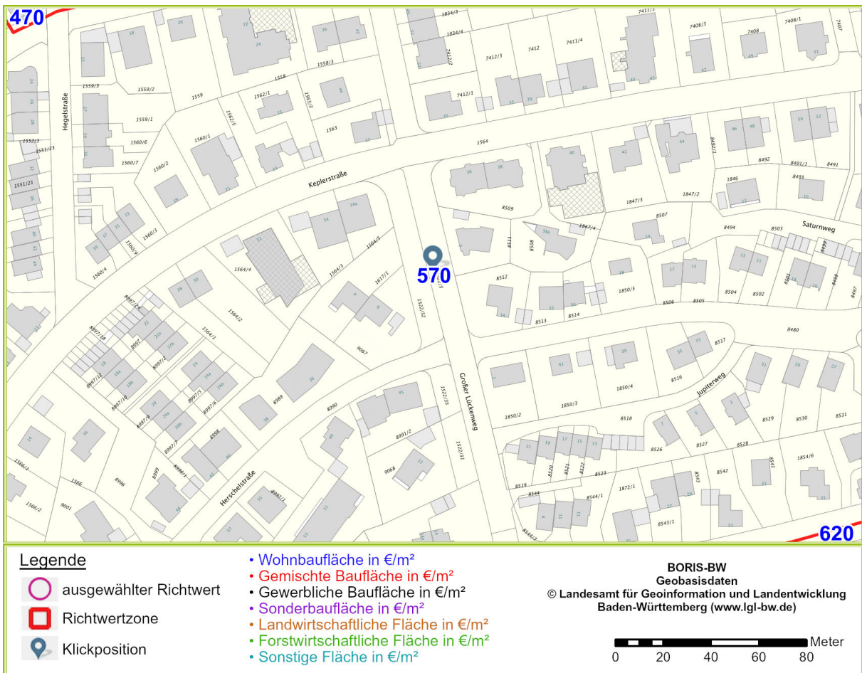
Abbildung 2: zentralisierte Darstellung der Klickposition mit den gewählten Einstellungen von Maßstab und Hintergrundkarte am Bildschirm

Der von Ihnen gewählte Bereich liegt in der Gemeinde/Stadt Pforzheim. Die Darstellung dieses Kartenbereichs kann durch den Anwender individuell beeinflusst werden, z.B. durch Ändern der Klickposition, des Zoommaßstabs oder der Auswahl der Hintergrundkarte.